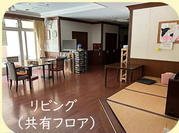
リビング (共有フロア)

全室個室のユニット型です。 室内には洗面台やトイレも ございます。 お食事や交流はリビングにて、 家庭的な雰囲気の中で お過ごしいただけます。