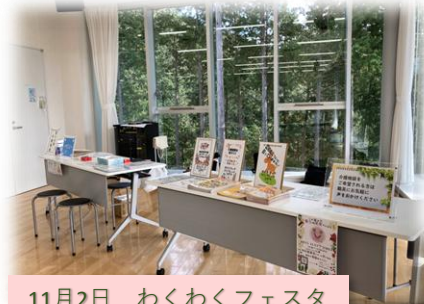
11月2日 わくわくフェスタ